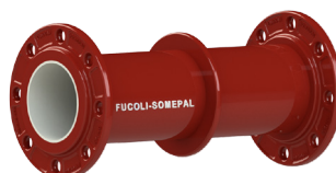
Flange passa-muros fixa de DN 250 a DN 800